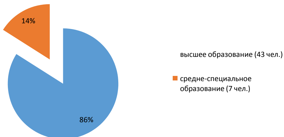
Рисунок 1. Диаграмма характеристика педагогического кадрового состава.

Далее представлено деление пед.состава в соответствии с педагогическим стажем работы, что представлено ниже на рис.2: